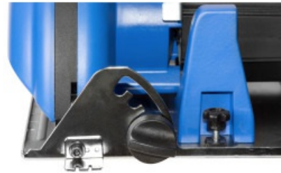
Stufenlose und bequeme Einstellung des Gehrungswinkels; Rasterungen bei 0°, 15°, 30° und 45°