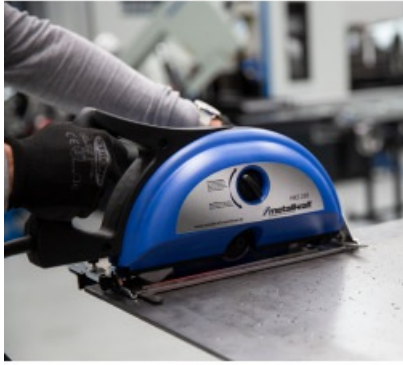
Zweifach geführter Parallelanschlag für exakte Schnittführung