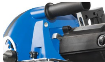
Schneller Sägeblattwechsel durch Getriebearretierstift