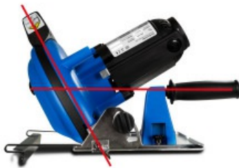
Handgriff kann bei Gehrungsschnitten ummontiert werden, so dass die Säge parallel zur Schnittebene sicher geführt werden kann